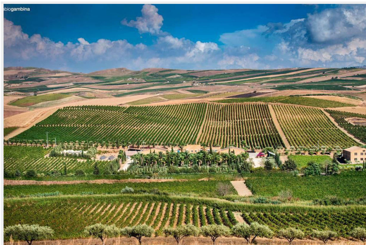
Vườn nho của Donnafugata ở Sicily, Nam Ý

Giống nho Nerello Mascalese sinh trưởng trên đất đá núi lửa của núi Etna, giàu tannin và có hương vị đậm đà. Còn giống nho Nocera thơm hương trái cây fruity, sáng khoái cho mùa hè. Kết hợp với nhau, chúng làm nên chai rượu vang hồng “có hương vị thanh thoát của hoa nhài, vị dâu tây, đào và bergamot”, theo thương hiệu.